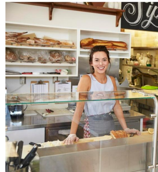
Punto de Venta