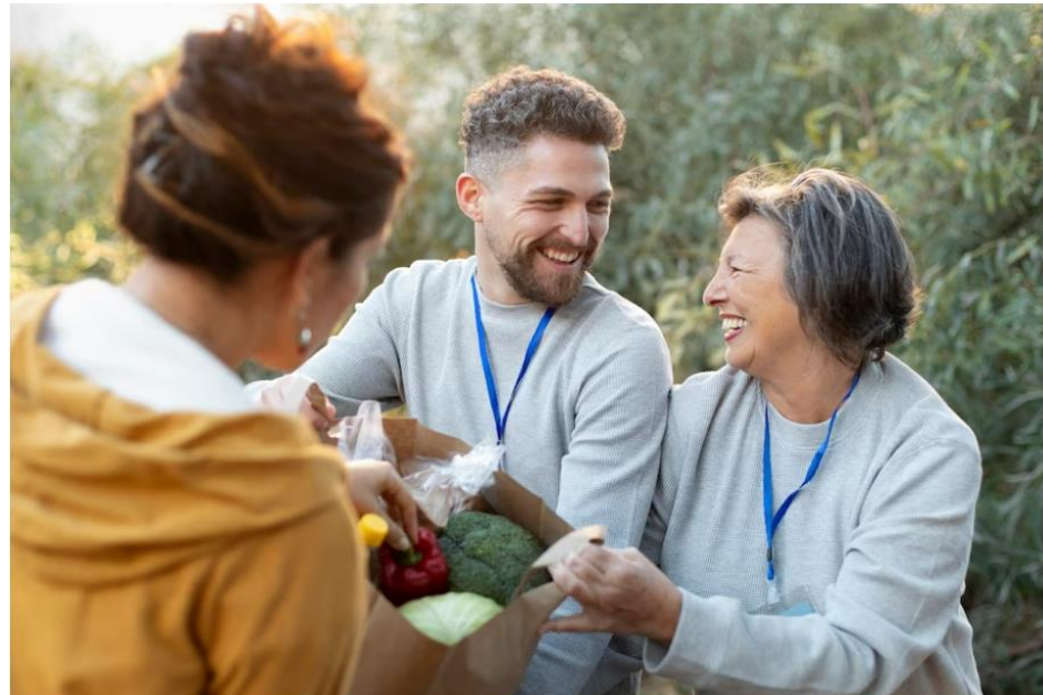
Compromiso con la comunidad